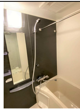
※別部屋の写真になります。