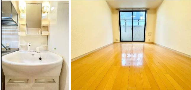
※別部屋の写真になります