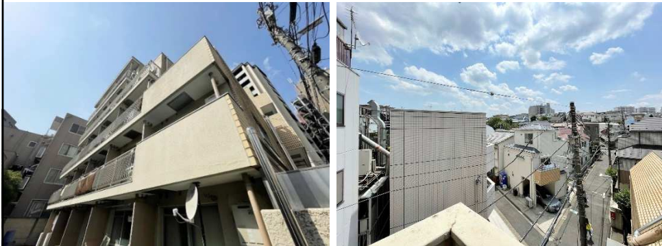
窓からの眺望です