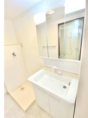
※別部屋の写真になります