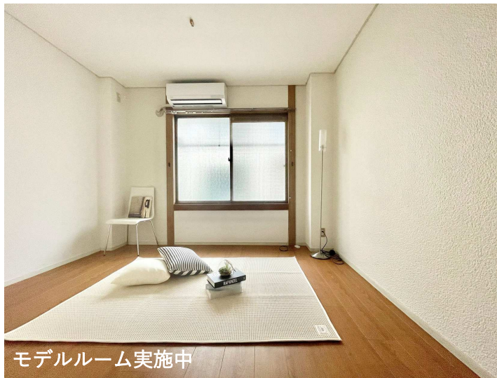
モデルルーム実施中